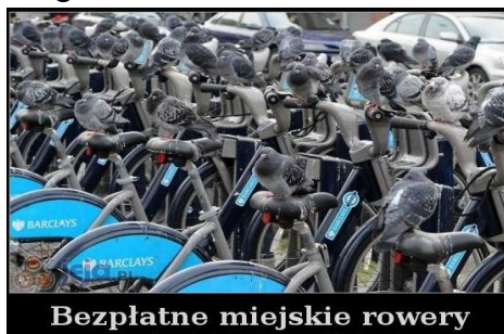
Bezpłatne miejskie rowery byłaby szkoda, gdyby ktoś je obsrał