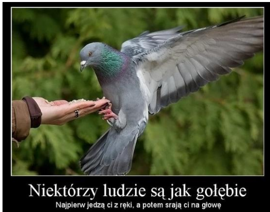
Niektórzy ludzie są jak gołębie Najpierw jedzą ci z ręki, a potem srają ci na głowę