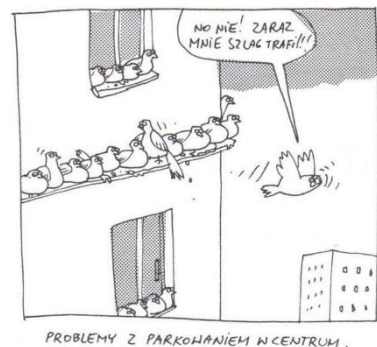
PROBLEMY Z PARKOWANIEM W CENTRUM.