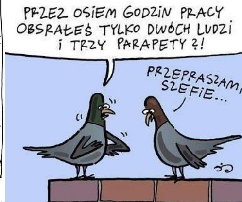
PRZEZ OSIEM GODZIN PRACY OBSRĄŁEŚ TYLKO DWOCH LUDZI I TRZY PARAPETY?!