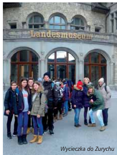
Wycieczka do Zurychu