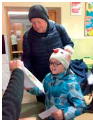
Tuż przed wyruszeniem na trasę, radość z otrzymania mapy i możliwości wyruszenia w teren

szych super zabawę z odnajdywaniem lamponików i ich potwierdzeniem perforatorem na terenie Szkoły Podstawowej numer 124 przy ul. Bartoszyckiej 45/47 w warszawskiej Falenicy, gdzie także znajduje się centrum zawodów. Dla dzieciaków jest to naprawdę niesamowite przeżycie i radość z odnalezienia i potwierdzenia punktów kontrolnych na karcie startowej – bez względu na panujące warunki atmosferyczne